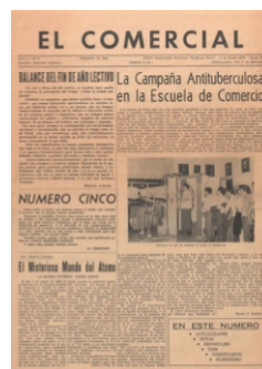
Tapa del periódico publicado por la institución correspondiente al ejemplar N° 5 del año 1964.

Mural pintado por alumnos del colegio con la conducción de la profesora María Aquatti